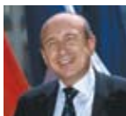
Gérard Collomb, Senador Alcalde de Lyon. Presidente del Gran Lyon